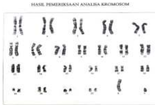
Gambar 3. Analisis kromosom pada Tn. N menunjukkan karyotip normal (46, XY) dengan jumlah kromosom 46 dengan kromosom seks XY.